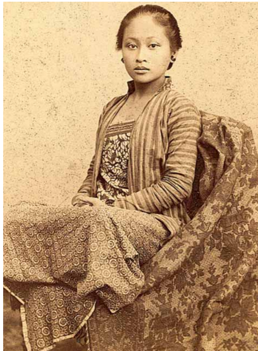
88. Fotografia studyjna kobiety jawajskiej, wykonana w Yogyakarcie w końcu XIX w. Photograph of a Javanese woman taken in a Yogyakarta studio at the end of 19 th c.

Swoistą ciekawostką w zbiorach Raciborskiego stanowi kilkanaście XIX-wiecznych portretów ludności jawajskiej. Po 1860 r. w większych miastach Jawy powstały studia fotograficzne, w których, na tle namalowanych krajobrazów wykonywano między innymi rodzajowe zdjęcia tak zwanych typów jawajskich. Portrety te, naśladujące zdjęcia dokumentalne, często przedstawiały codzienne zajęcia lub rozrywki ludności jawajskiej, na przykład tańce, walki kogutów, palarnie opium, uroczystość zaślubin, wyidealizowane postacie kobiet itp. Fotografie tego rodzaju, dość często przywożone jako pamiątki z zamorskich podróży, miały duży wpływ na umacnianie stereotypowych wyobrażeń o mieszkańcach odległych krajów 14 .